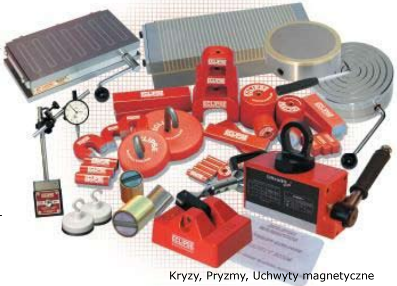
Kryzy, Pryzmy, Uchwyty magnetyczne